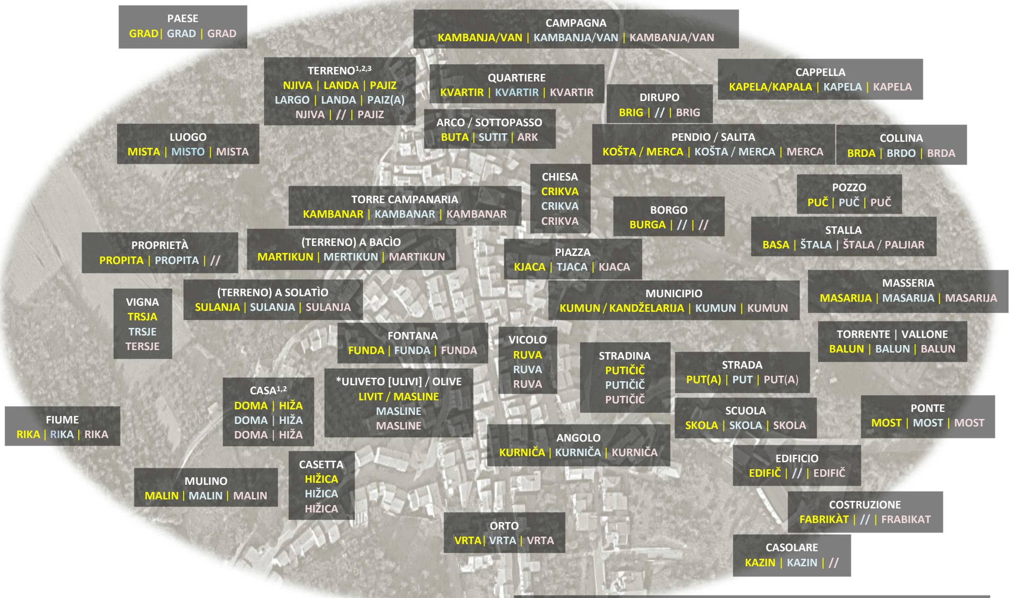
3. Tavola lessicale I – Lessico dello spazio pubblico

Legenda – ACQUAVIVA C. | MONTEMITRO | SAN FELICE DEL MOLISE